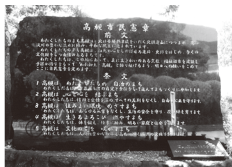
写真ご投稿 「高槻市民憲章」西村 保先生 (学 4 期)

誌面を彩るお写真も新たに募集します。季節の風景、お住まいの地域の情緒ある街並みなどをお送りください。なお、掲載時期及び掲載の有無に関してはご一任くださいますようお願い致します。