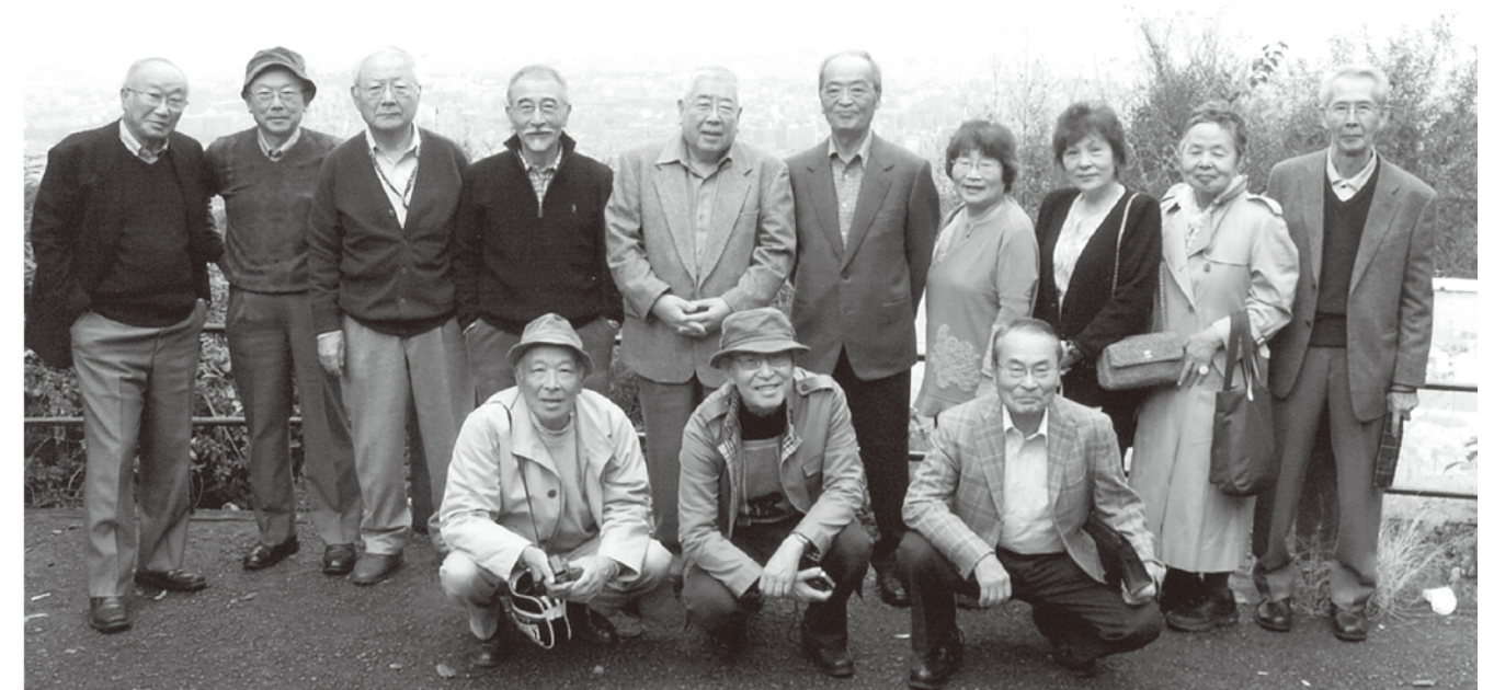
東山ドライブウェイ展望台で京都市街を背景に

この会は毎年開催を予定していますので、さらに多くの同期生のご参加を期待してやみません。